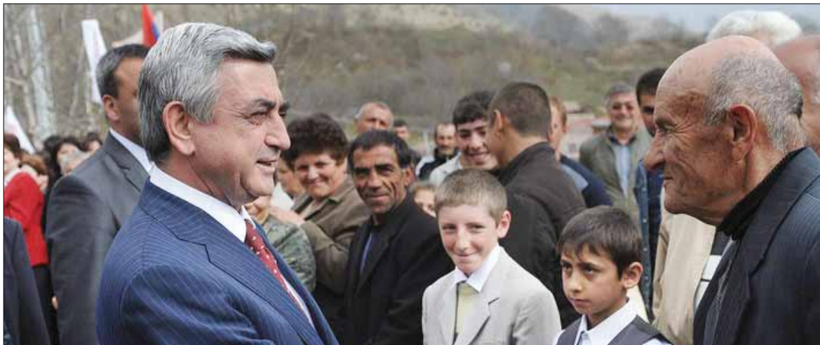
Սերժ Սարգսյանի՝ սյունիքյան վերջին այցի դրվագ:

ցով թանգարանի երկու մասնաշենքի հիմնանորոգման աշխատանքները ս.թ. մարտի վերջին ավարտվել են: Հանրապետության ղեկավարին շրջայցի ժամանակ զեկուցվել է, որ երկրագիտական թանգարանի հիմնանորոգման համար 2011թ. ընթացքում հատկացված գումարով հիմնվին փոխվել են երկու մասնաշենքի տանիքները, հիմնանորոգվել են հատակները, փոխվել են դռները եւ պատուհանները, կատարվել են ներքին հարդարման աշխատանքներ, վերականգնվել է ջեռուցման համակարգը, իրականացվել են արտաքին բարեկարգման աշխատանքներ: Այդպիսով լուծվել են թանգարանային արժեքների պահպանության, ամվտանգության, թանգարանային նյութերի մշտական, ժամանակավոր