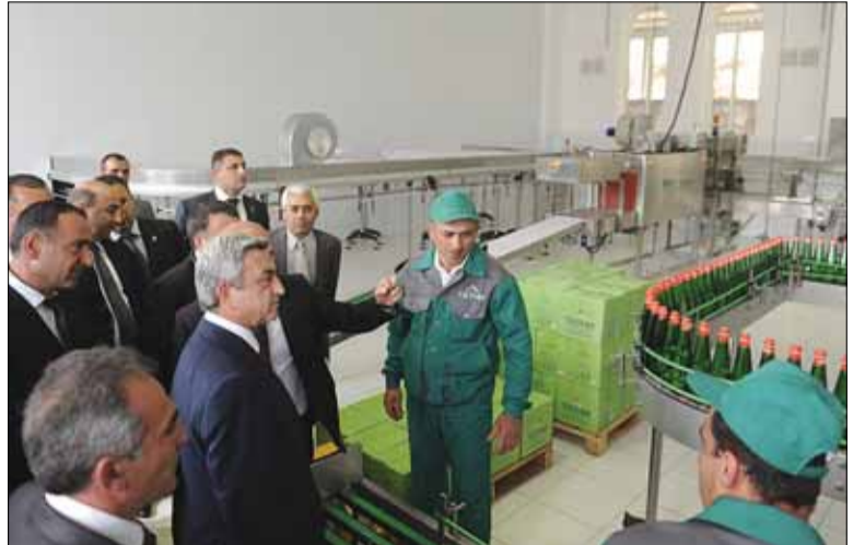
17.04.2012, Սերժ Սարգսյանը «Շամբ բիզնես» ընկերությունում: